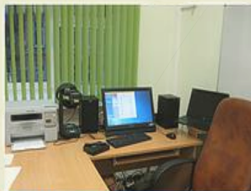
1. Рабочее место учителя

! Оборудовать отдельный класс- (помещение), поделенный на зоны