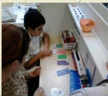
4. Места для индивидуальных занятий