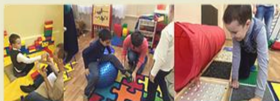
5. Зона сенсорной разгрузки