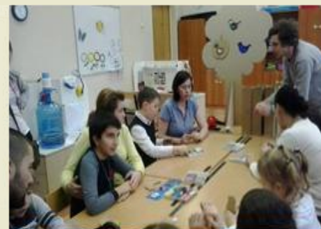
3. Место для групповых занятий