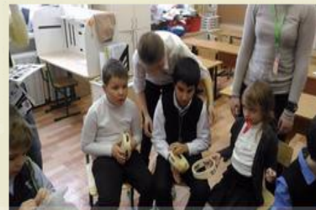
2. Место для проведения «круга»